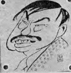
Caricatura de Laval, por Palacios.

Su ascensión al más alto rango de su carrera política, quiere dar el traste con las relaciones amistosas de las democracias con Francia.— La ascensión de Laval al poder no es sino el primer paso de Hitler en su ofensiva de primavera. Laval puede ser el hombre que inicie la reconquista de SIRIA, OCUPADA POR INGLESES Y FRANCESES LIBRES. Lo que puede traer como consecuencia, la ocupación de las colonias francesas por fuerzas norteamericanas.— La situación de Francia es muy crítica; tan crítica como cuando firmó el armisticio con Alemania